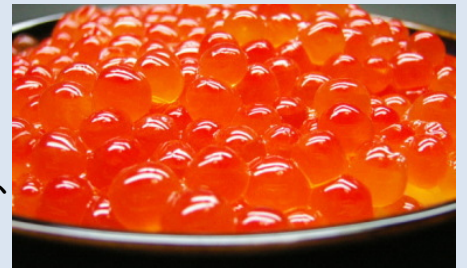
せかいさんだいちんみ

日本でイクラといえば、赤いサケやマスの卵を思い浮かべますが、ロシアには黒いイクラがあります。そもそも、イクラとは、ロシア語で「魚の卵」のことを指します。そのため、日本で食べられているイクラは、ロシアでは、赤いイクラと呼ばれます。では、黒いイクラとはなんなのでしょうか？黒いイクラとは、世界三大珍味のひとつである「キャビア」です。キャビアはチョウザメの卵から作られます。他の色のイクラもまだまだあるかもしれません！探してみてください。