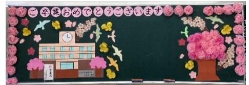
【5年生がつくった掲示物】