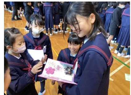
【プレゼント渡しの様子】