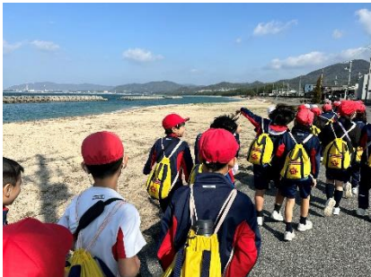
【海岸付近を歩く様子】

3月1日にお別れ遠足を行いました。前日に大雨が降っておりましたので実施が危ぶまれましたが、行きのルートを変更するなどして、何とか実施することができました。子どもたちは思い出をたくさんつくれました。また、3月5日には、6年生を送る会を行いました。6年生に感謝の気持ちを伝える出し物をしたり、ファミリーの6年生にプレゼントを渡したりしました。心温まる会になりました。