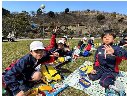
【弁当を食べている様子】