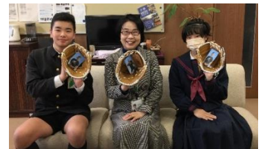
【スポーツ委員会代表者と記念写真】