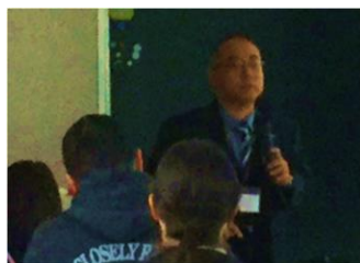
【岩金 SSW の講演の様子】

1月19日（金）に小中同日参観日を行いました。この日、子どもたちは朝からそわそわしておりました。「今日、お母さんが来てくれるよ。」「照れくさいけど楽しみ。」と言っておりました。子どもたちは自分の姿を見てもらいたいのでしょう。子どもたちは様々な関わりを通して成長してきております。子どもたちの頑張りを認め、しっかり褒めたいところです。