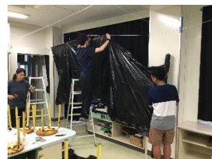
【おぼけやしき準備の様子】

ここまで準備や運営をしてくださったPTA厚生部の皆様、PTA役員の皆様、ボランティアの皆様には感謝の言葉もございません。おかげさまで、子どもたちの思い出がまた1つ増えました。本当にありがとうございました。