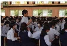
【質問している様子】