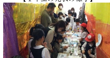
【賑わっている6年生のブース】