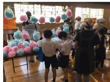
【手作りの綿菓子も大人気】