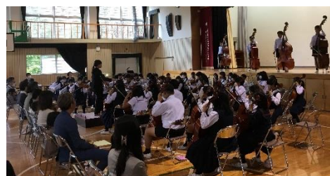
【合奏班の演奏でお出迎え】

保護者の皆様におかれましては、児童募集の周知を図るため、ポスターの掲示に御協力いただける方を募っております。 御協力いただける方は、枚数とサイズを事務室に、電話でかまいませんのでお知らせください。(サイズはA3またはA4となります。)