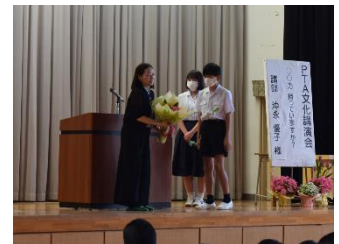
【お礼の花束贈呈場面】