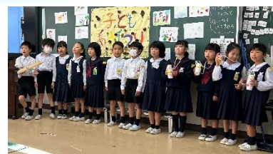
【1年生の発表の様子】

当日は御多用の中、多くの保護者の皆様に御来校いただき感謝いたします。ありがとうございました。