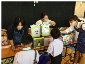
【くじ引きをしている様子】