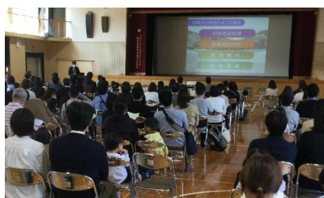
【本校教育についての説明場面】